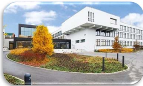
Hotel Campus Sursee Seminarzentrum, 62100. Sursee