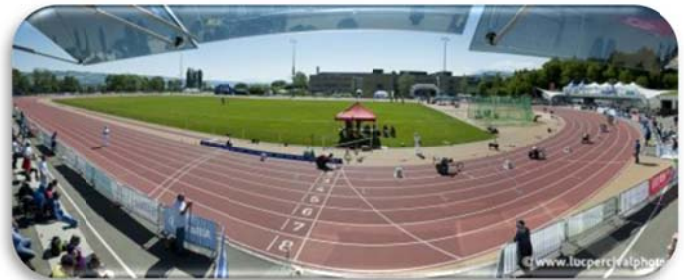
Swiss Paraplegic Center Guido A. Zäch-strasse 1. 6207. Notwill