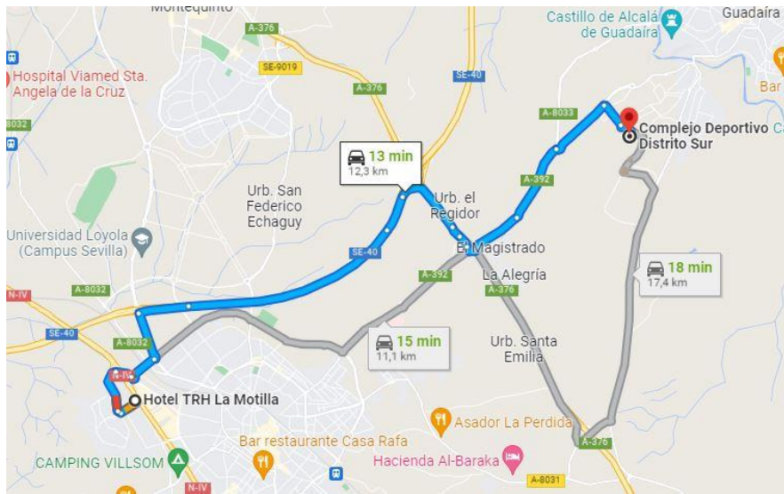
(Hotel TRH La Motilla)